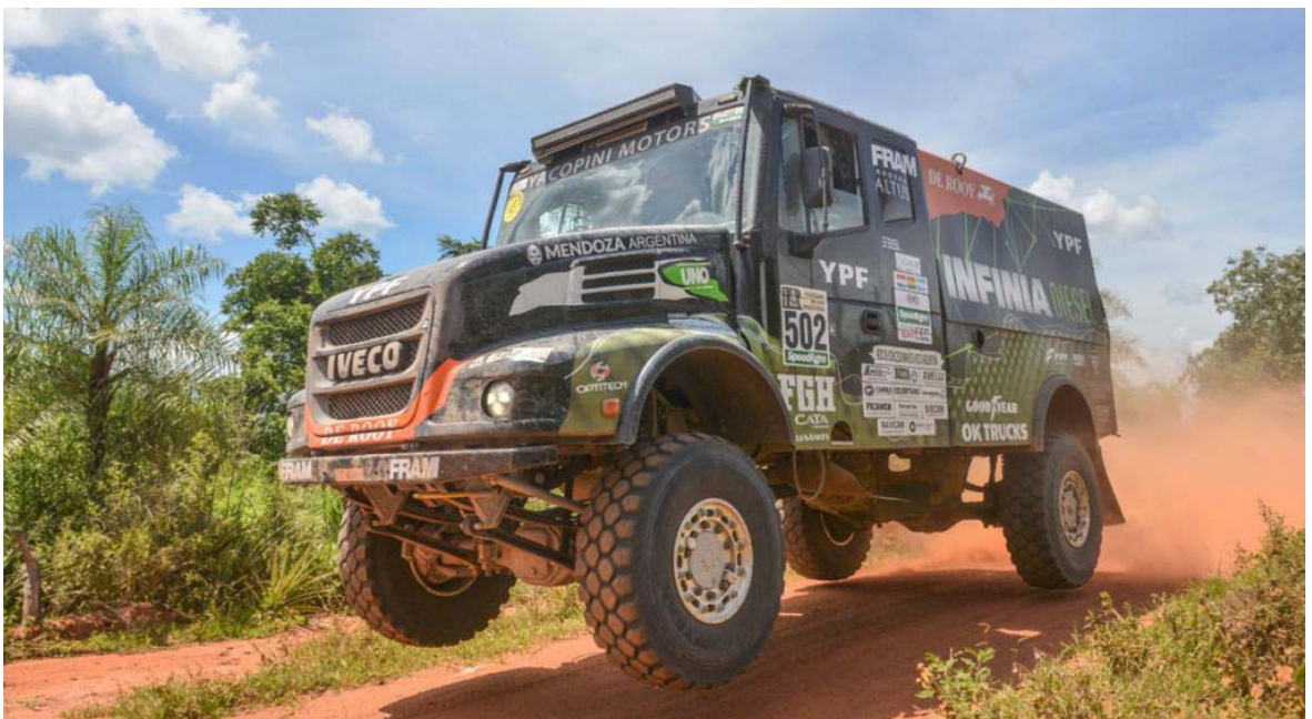
Federico Villagra 4to en camiones (IVECO).